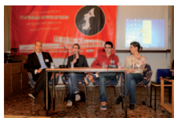
Jahreskonferenz 2011: Zeitgeist Revolution

Außerdem bringt das Willy Brandt Center jedes Jahr Partnerorganisationen, Freundinnen und Freunde des Zentrums zu einer gemeinsamen Jahreskonferenz zusammen. Die diesjährige Konferenz am 22. Oktober stand unter dem Motto „Zeitgeist: Revolution“ und setzte sich länderübergreifend mit dem Protest junger Menschen gegen soziale Ungleichheit und Unterdrückung auseinander. Auch wenn die jungen Menschen auf dem Tahrir-Platz von Kairo, dem Rothschild-Boulevard in Tel Aviv oder der Puerta del Sol in Madrid vieles unterscheidet, eint sie der Wunsch nach Selbstbestimmung und Gerechtigkeit – so-