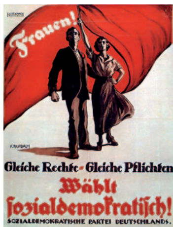
SPD-Wahlplakat von 1919

So weist Norwegen die europaweit höchste Geburtenrate