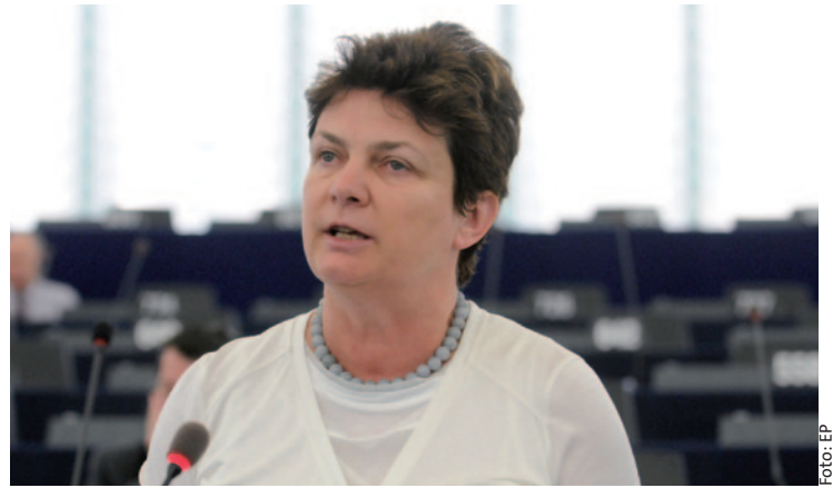
Constanze Krehl im Europäischen Parlament in Strasbourg

Entscheidungsfindungen sind in der Europäischen Union oft ein mühsames Ringen um die richtige Richtung und die nötigen Kompromisse. Das gilt besonders dann, wenn zwischen Rat, Kommission und Parlament um viel Geld verhandelt wird. Auch Expertinnen und Experten verlieren bei den vielen Zwischenschritten und den (für die Klarheit in allen Amtssprachen nötigen) bürokratischen Formulierungen schnell den Überblick. So überraschte vor Kurzem selbst der Sächsische Justiz- und Europaminister mit der Aussage, die zukünftigen EU-Fördermittel für die Stadt Leipzig stünden fest. Dem ist leider noch nicht so, auch wenn die Zeichen gut stehen, dass die dringend benötigten Mittel auch weiterhin fließen. Ein Überblick zum Stand der Dinge.